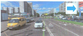
ПЕРЕСЕЧЕНИЕ: ул. Ясеневая. ул. Ореховый б-р.