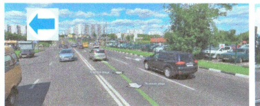
ПЕРЕСЕЧЕНИЕ: ул. Воронежская. ул. Ясеневая.