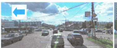
ПЕРЕСЕЧЕНИЕ: ул. Генерала Белова. ул. Ореховый б-р.