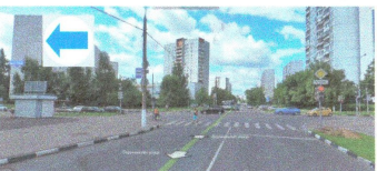
ПЕРЕСЕЧЕНИЕ: ул. Воронежская. ул. Елецкая.