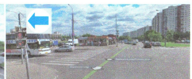
ПЕРЕСЕЧЕНИЕ: ул. Ясеневая. ул. Воронежская.