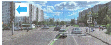
ПЕРЕСЕЧЕНИЕ: ул. Воронежская. ул. Ясеневая.