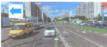
ПЕРЕСЕЧЕНИЕ: ул. Ясеневая. ул. Ореховый б-р.