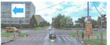
ПЕРЕСЕЧЕНИЕ: ул. Ясеневая. ул. Елецкая.