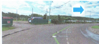
ПЕРЕСЕЧЕНИЕ: ул. Воронежская. ул. Гурьевский пр-д.