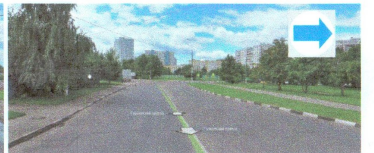
ПЕРЕСЕЧЕНИЕ: ул. Тамбовская. ул. Гурьевский пр-д.