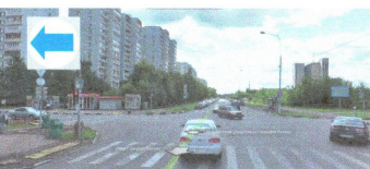
ПЕРЕСЕЧЕНИЕ: ул. Генерала Белова. ул. Воронежская.