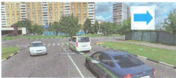
ПЕРЕСЕЧЕНИЕ: ул. Тамбовская. ул. Ясеневая.