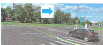
ПЕРЕСЕЧЕНИЕ: ул. Кустанайская. ул. Шипиловская.