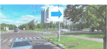
ПЕРЕСЕЧЕНИЕ: ул. Шипиловская. ул. Мусы Джалиля.