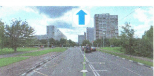
ПЕРЕСЕЧЕНИЕ: ул. Задонский пр-д. ул. Ореховый пр-д.