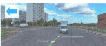
ПЕРЕСЕЧЕНИЕ: ул. Ореховый 6-р. ул. Кустанайская.