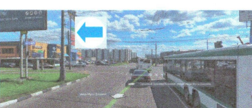
ПЕРЕСЕЧЕНИЕ: ул. Мусы Джалиля. ул. Ореховый 6-р.