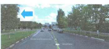
ПЕРЕСЕЧЕНИЕ: ул. Ореховый пр-д. ул. Шипиловская.